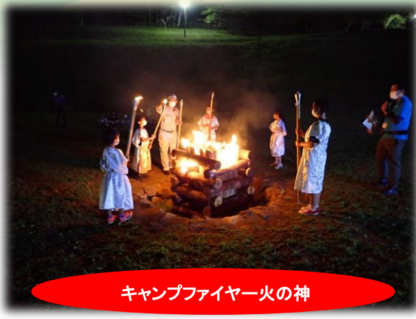
キャンプファイヤー火の神