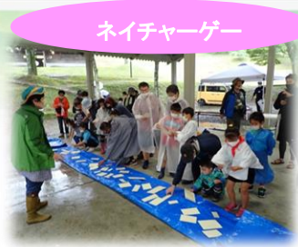
ネイチャーゲーム